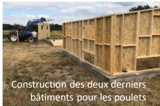
Construction des deux derniers bâtiments pour les poulets