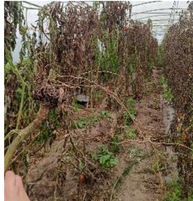
Non greffés maison

Arrachage des pieds de tomates qui ne font pas de prolongation cette année. Le feuillage est complètement mort. Il n'y a quasiment plus de fruits. On ne peut plus rien attendre des pieds dans cet état ! L'arrachage permet d'observer la prospection racinaire. On voit très nettement la différence du chevelu racinaire des pieds greffés (très vigoureux et développé) et celui de la variété ancienne (atrophié). Le rendement est évidemment impacté !